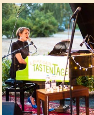
2020 finden die 4. Leipziger Tastentage statt.

Kultur im SCHLOSSpark 03. bis 13. September