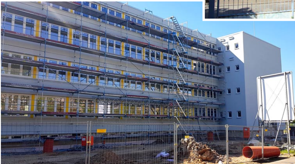
Das Lichtenberg-Gymnasium in der Bauendphase.

Weiterhin soll, gemäß Schulentwicklungsplan, in der Karlsruher Straße eine vierzügige Grundschule mit Zwei-Feld-Sporthalle zum Schuljahresbeginn 2025/26 entstehen.« Das wäre dann der erste vollständige Schulneubau