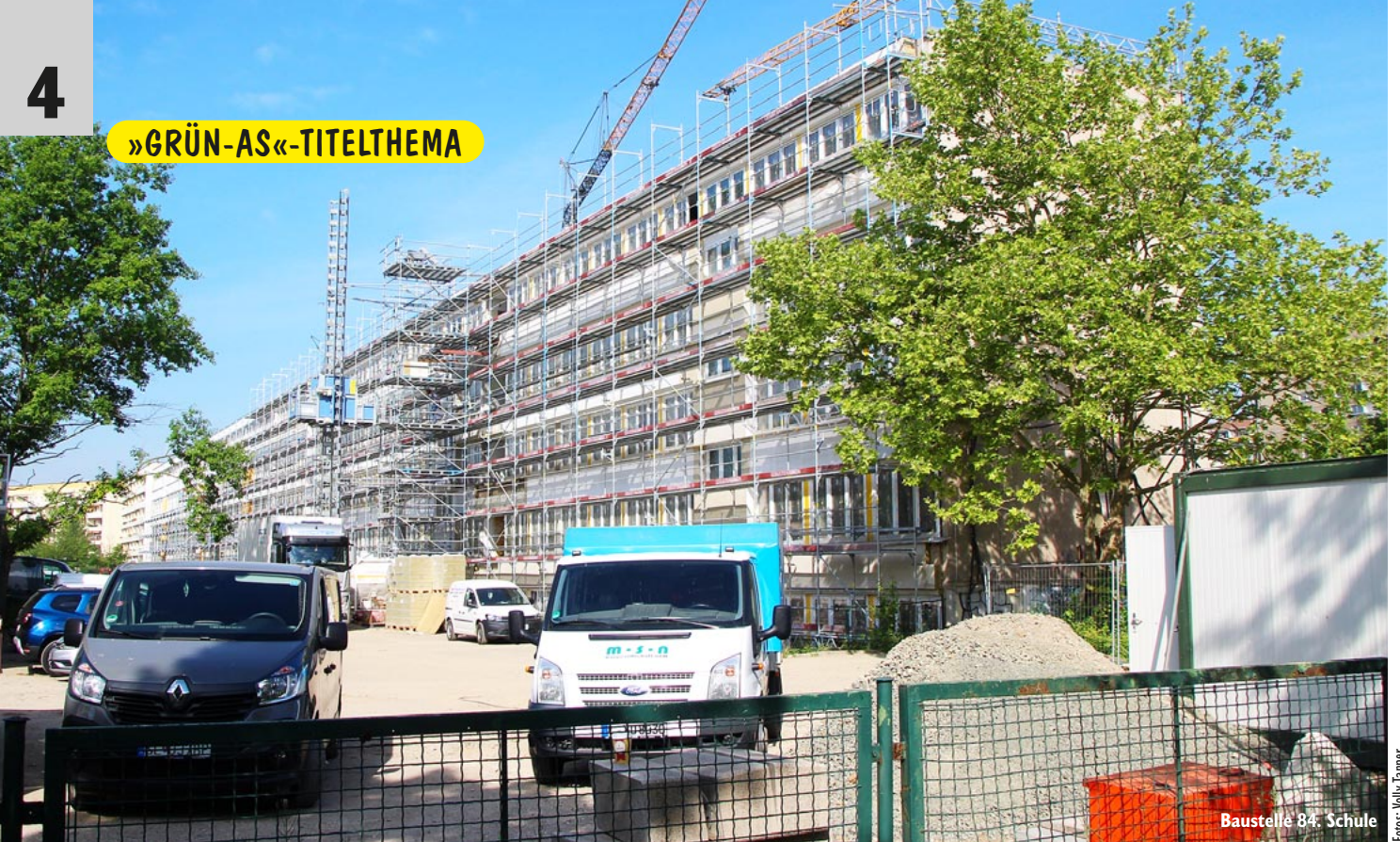
Baustelle 84. Schule