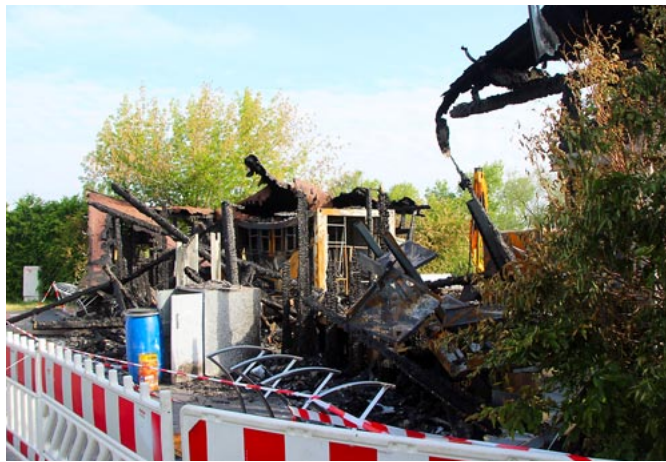
Die Reste des Strandbadgebäudes auf der Markranstädter Seite des Sees.

Um mehr zu erfahren fragten wir bei der Pressestelle der Polizeidirektion Leipzig nach und bekamen von Sandra Freitag Antwort: »Montagvormittag war ein Brandursachenermittler mit der Untersuchung des Brandortes beauftragt.