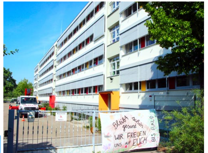
Fertiggestellt und wartend auf Normalität: die 85. Schule.

Parallel dazu laufen derzeit die energetischen Sanierungen an der