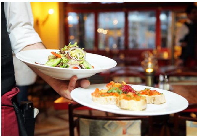
Die Gastronomen atmen auf: Es darf wieder serviert werden.

An der alten Frieda am Kulki, welche seit letztem Jahr den Namen »Am See« trägt, plant man gerade die Neueröffnung des Freisitzes. Hier wurde in den letzten Wochen fleißig gewerkelt und schon mal vorab ein Test zu Himmelfahrt durchgeführt. Seit dem 1. Juni ist täglich ab 12 Uhr geöffnet. Neben leckeren Burgern, gesunden Bowls und Salaten, erwarten den Gast auch verschiedene Eisbecher und Kaffeespezialitäten. Also für Jeden ist etwas dabei und dann wird ja auch an der Sanierung und dem